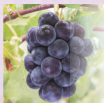
オーロラブラック

シャインマスカットの子ども。シャインよりもマスカットの香りが強く、おいしいと注目の品種。