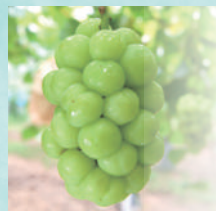
瀬戸ジャイアンツ

酸味は少なく、濃厚な甘さ。皮離れが良く、ジューシーで旨味がギュッと詰まっています。