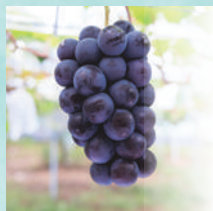
マスカット・ノワール