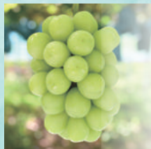
シャインマスカット

酸味はほとんどなく、糖度が高く濃厚！爽やかなマスカットの香りが口いっぱいに広がります。